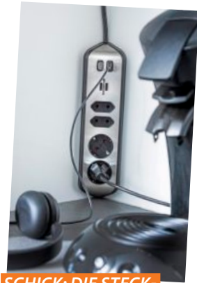
SCHICK: DIE STECKDOSENLEISTE PASST GUT IN DIE ECKE.

Anschlussleitung. In der 6er-Variante sind zwei zusätzliche Schuko-Steckdosen verbaut. Außerdem ist die Leiste in Edelstahl/Schwarz oder Edelstahl/Weiß erhältlich. Praktische Klebepads gehören zum Lieferumfang. Infos unter www.brennenstuhl.com .