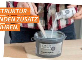
DEN STRUKTURGEBENDEN ZUSATZ EINRÜHREN.

mäßig deckend, sondern kreuz und quer, mal mit mehr, mal mit weniger Farbe. Nach etwa zwei Minuten nehmen Sie mit einer zweiten, kleinen Rolle einen Teil der aufgetragenen Lasur wieder ab. So entsteht eine marmorierte Oberfläche, die an Sand- bzw. Kalkstein erinnert. Der Effektzusatz verleiht der Fläche eine leicht körnige Struktur. 2,5 l Grundfarbe, 1 l Effektlasur und 150 g Effektzusatz ca. 45 Euro; www.schoener-wohnen-farbe.com .